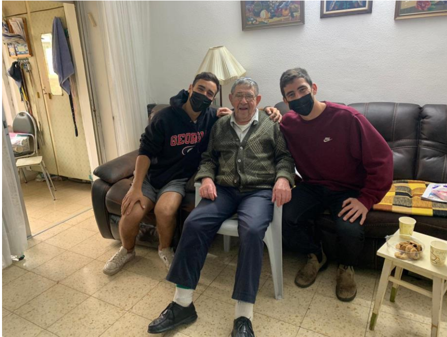
Bij Baruch in Jeruzalem