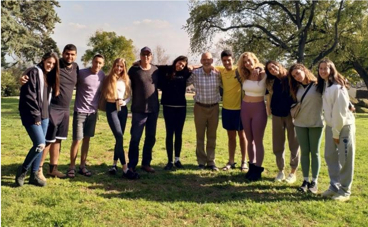
Studenten van Ma'ayan Baruch die vrijwillig werken voor L'chaim

Kijk naar het laatste video interview met studenten van Ma'ayan Baruch hoe zij hun bezoeken aan de shoa winnaars zien: https://youtu.be/IIEZy7DnK-U